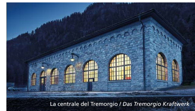
La centrale del Tremorgio / Das Tremorgio Kraftwerk

Il Lago Tremorgio è anche una preziosa testimonianza della storia della produzione idroelettrica del nostro Cantone. La centrale ai piedi della teleferica è infatti una delle più vecchie tuttora in funzione in Leventina. Le tavole de La via dell'energia di AET, poste alle stazioni di arrivo e di partenza della teleferica, raccontano questa storia.