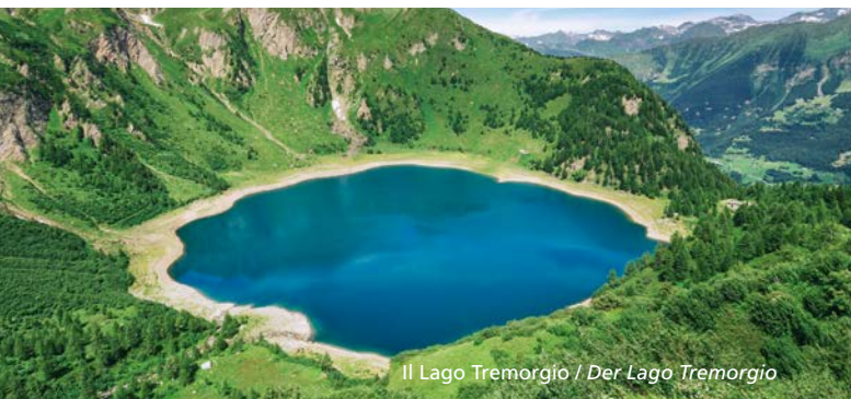
Il Lago Tremorgio / Der Lago Tremorgio

Supplemento trasporto di colli e/o materiali ingombranti (che occupano un posto): CHF 5. Gruppi/scuole: condizioni speciali su richiesta (contattare in orario d'ufficio). Zuschlag für voluminöses Gepäck/Rucksäcke: CHF 5. Gruppi/Schulklassen auf Anfrage (Informationen während den Bürozeiten).