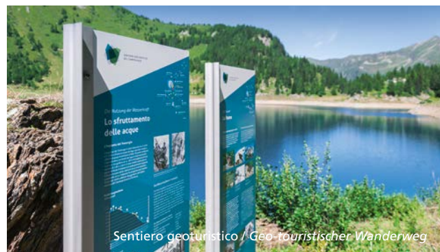
Sentiero geoturistico / Geo-touristischer Wanderweg