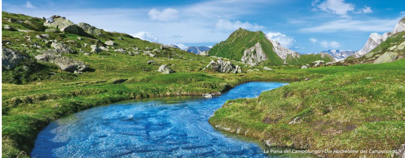
La Piana del Campolungo / Die Hochebene des Campolungo

+41 (0)91 867 15 44 info@campotencia.ch www.campotencia.ch