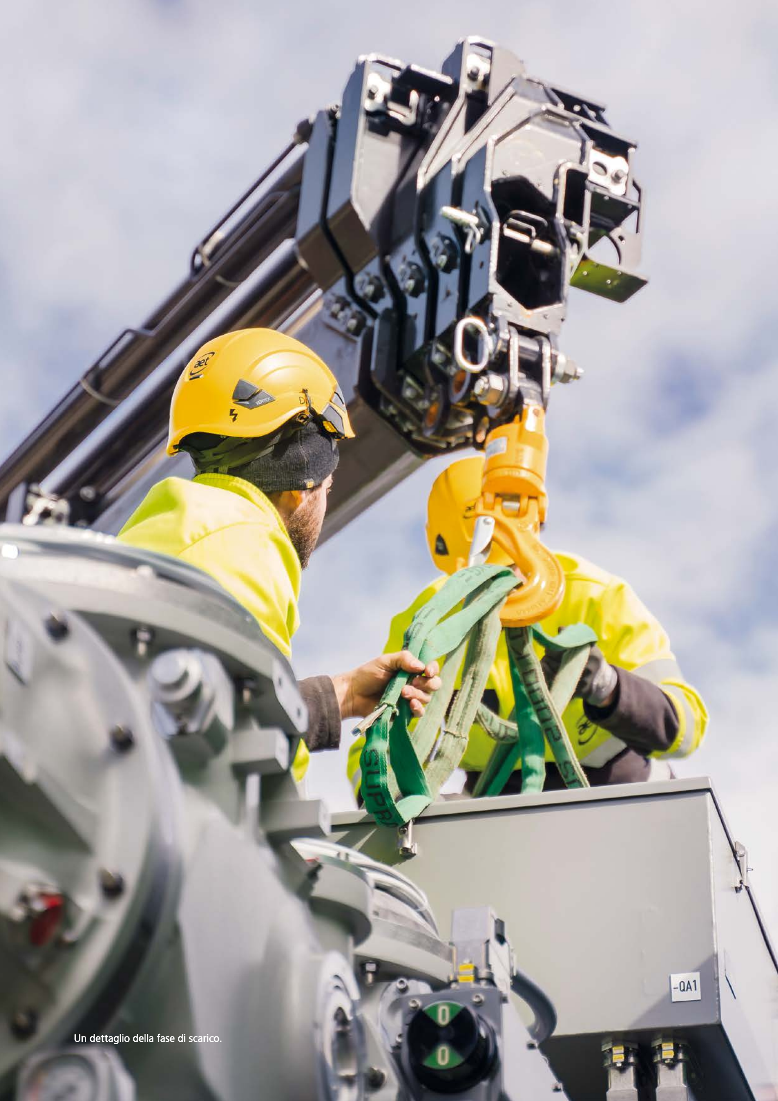
Un dettaglio della fase di scarico.