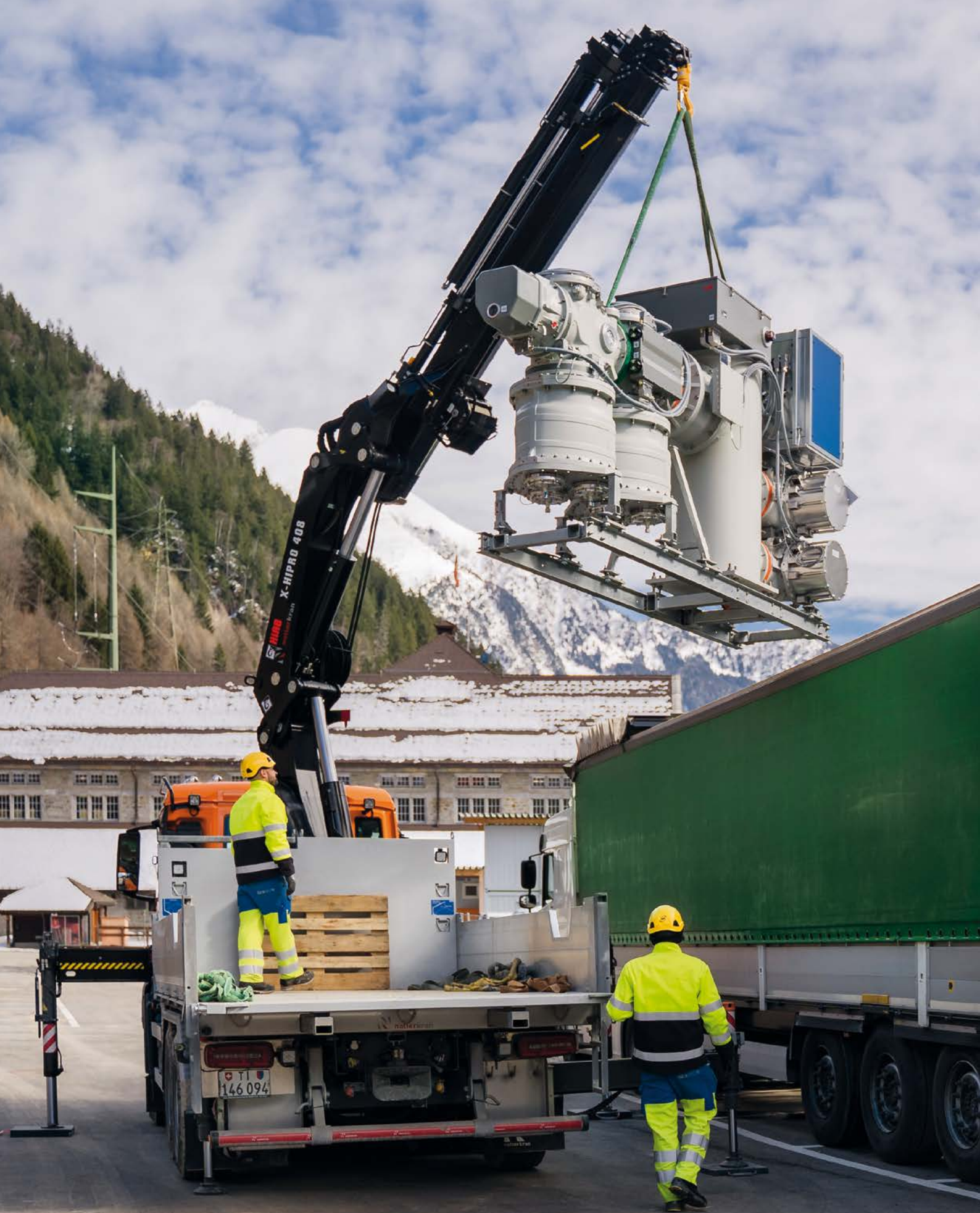
Il cuore della nuova sottostazione è costituito da un impianto di distribuzione 50 kV incapsulato e isolato a gas SF6 (GIS) che è stato consegnato sul cantiere alla fine dell'inverno.