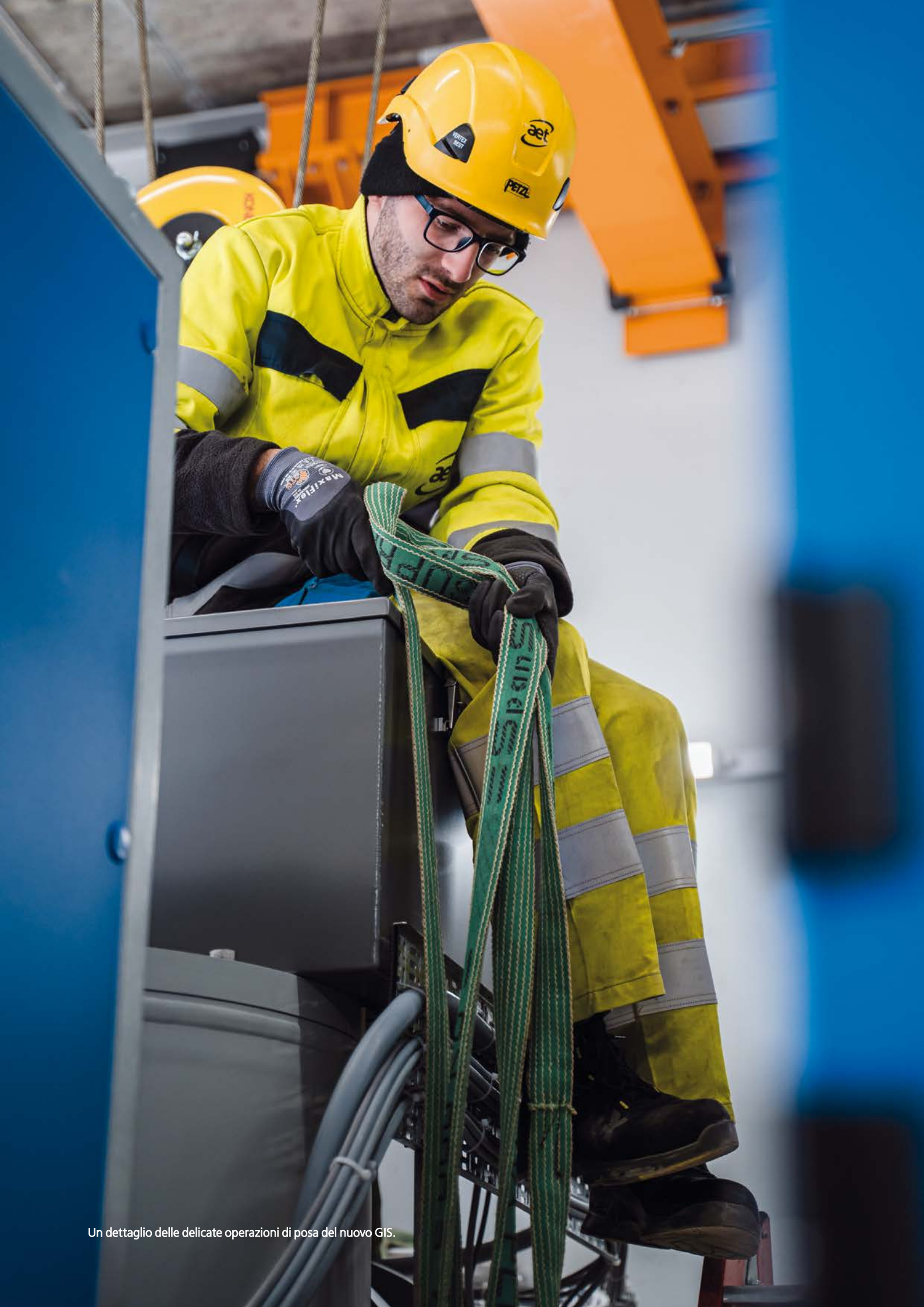
Un dettaglio delle delicate operazioni di posa del nuovo GIS.