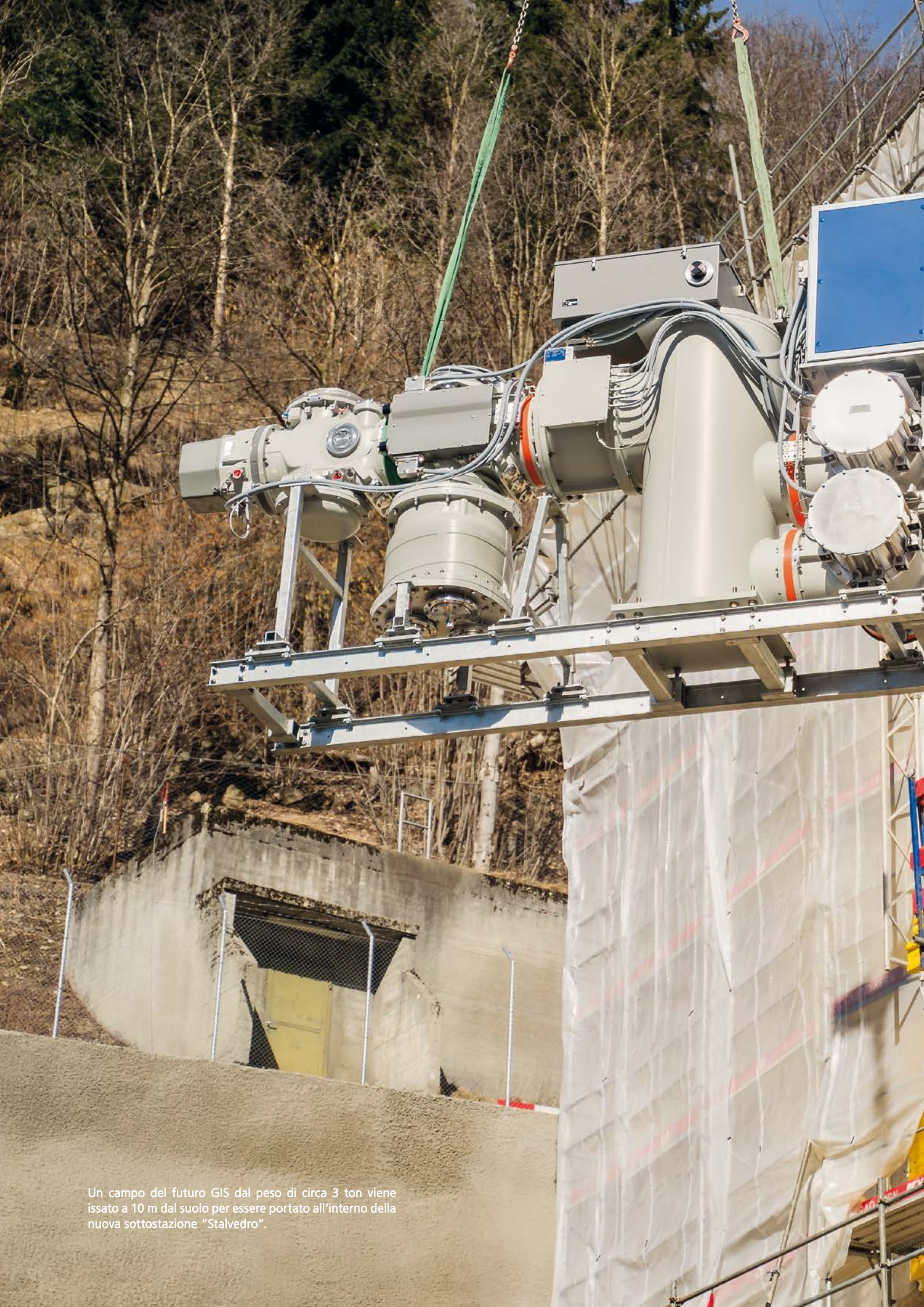
Un campo del futuro GIS dal peso di circa 3 ton viene issato a 10 m dal suolo per essere portato all'interno della nuova sottostazione "Stalvedro".