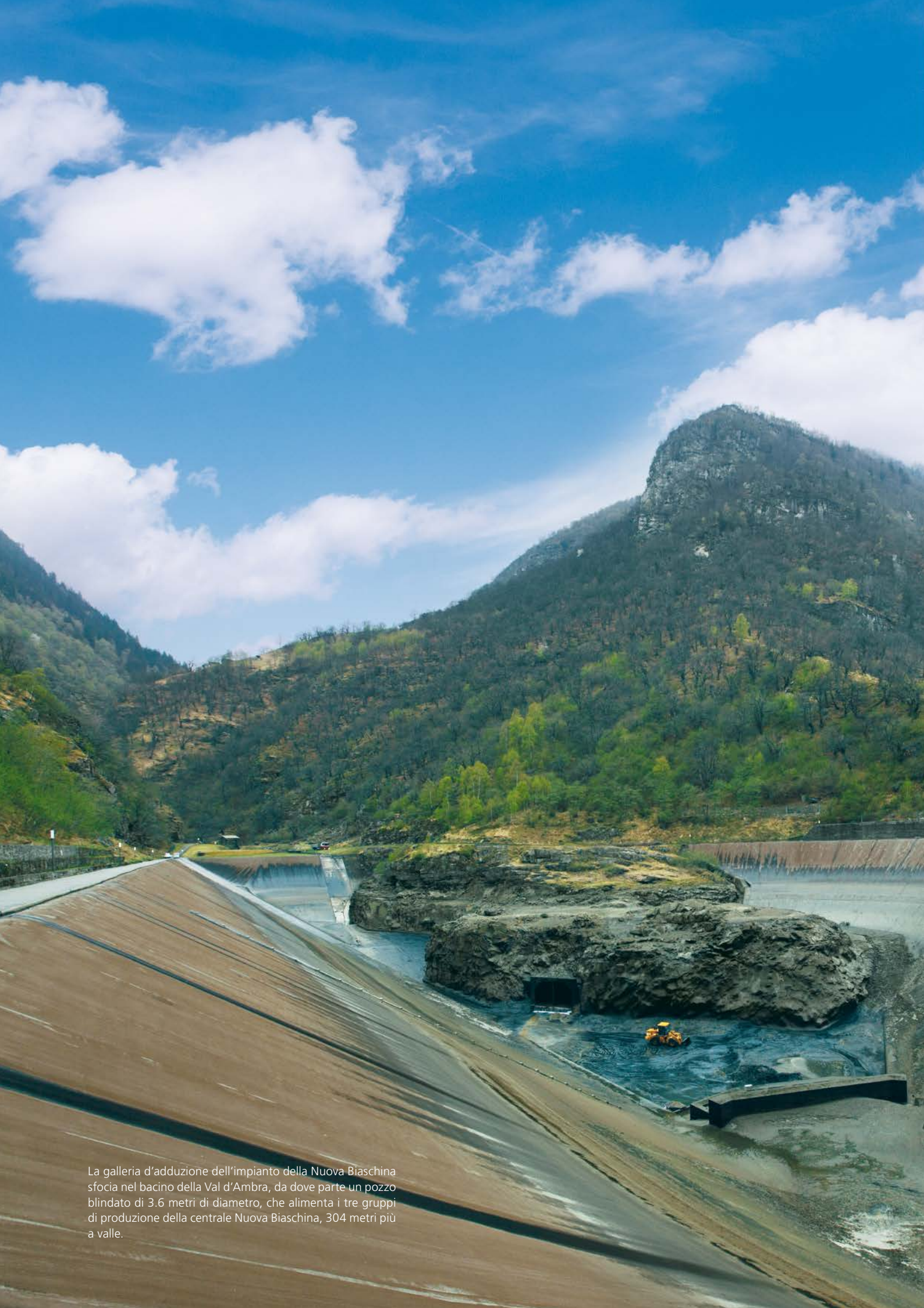
La galleria d'adduzione dell'impianto della Nuova Biaschina sfocia nel bacino della Val d'Ambra, da dove parte un pozzo blindato di 3.6 metri di diametro, che alimenta i tre gruppi di produzione della centrale Nuova Biaschina, 304 metri più a valle.