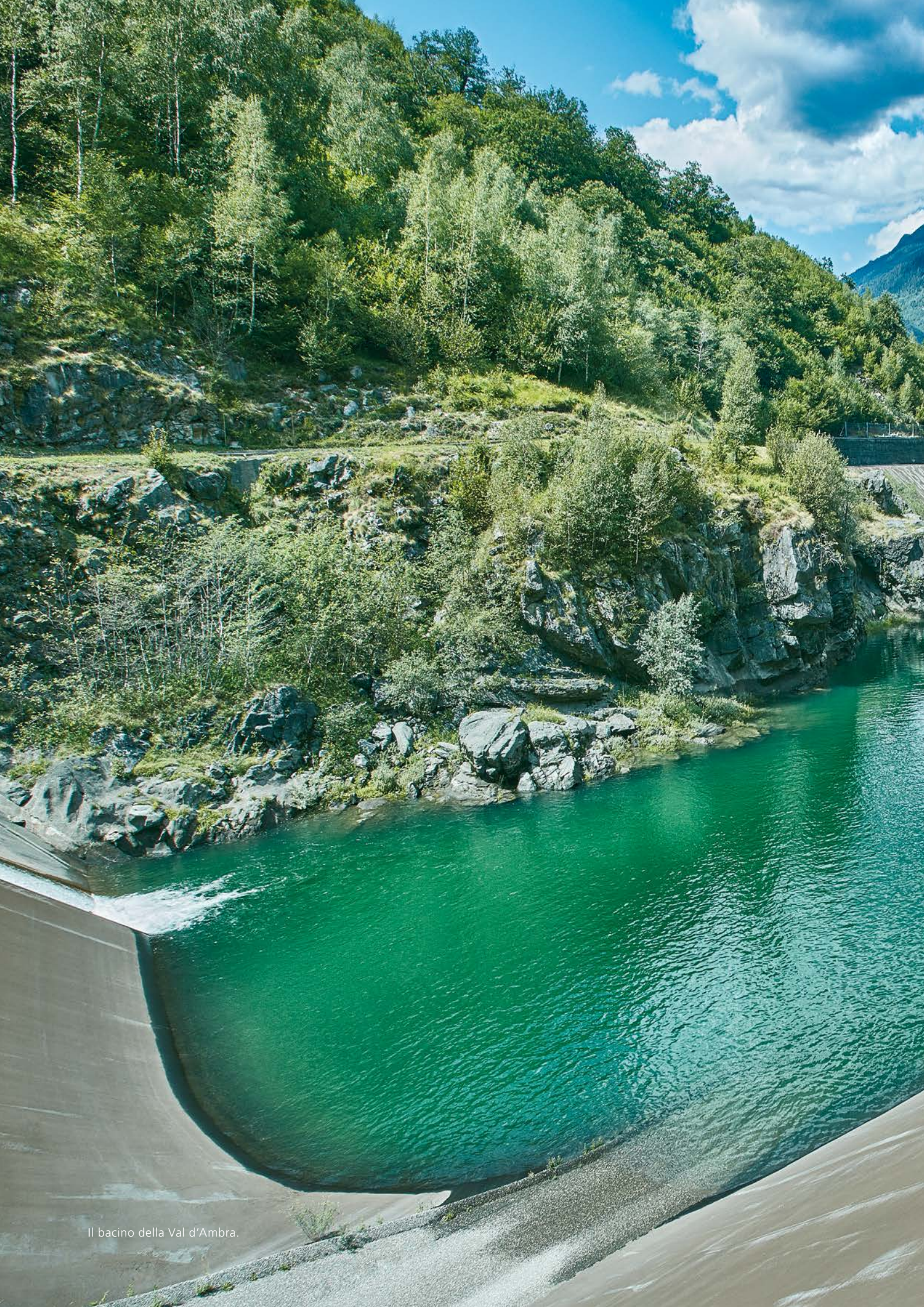
Il bacino della Val d'Ambra.