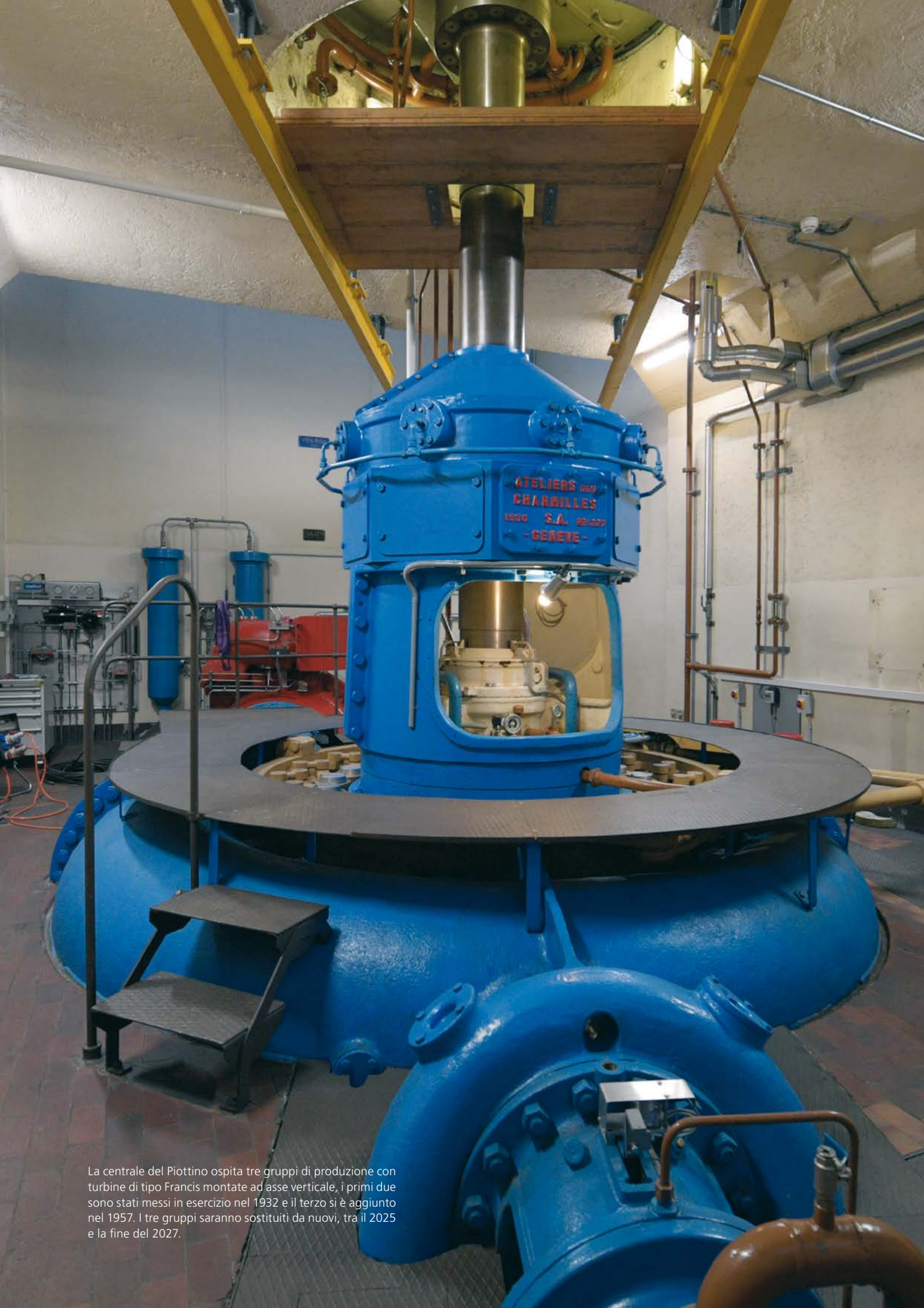
La centrale del Piottino ospita tre gruppi di produzione con turbine di tipo Francis montate ad asse verticale, i primi due sono stati messi in esercizio nel 1932 e il terzo si è aggiunto nel 1957. I tre gruppi saranno sostituiti da nuovi, tra il 2025 e la fine del 2027.