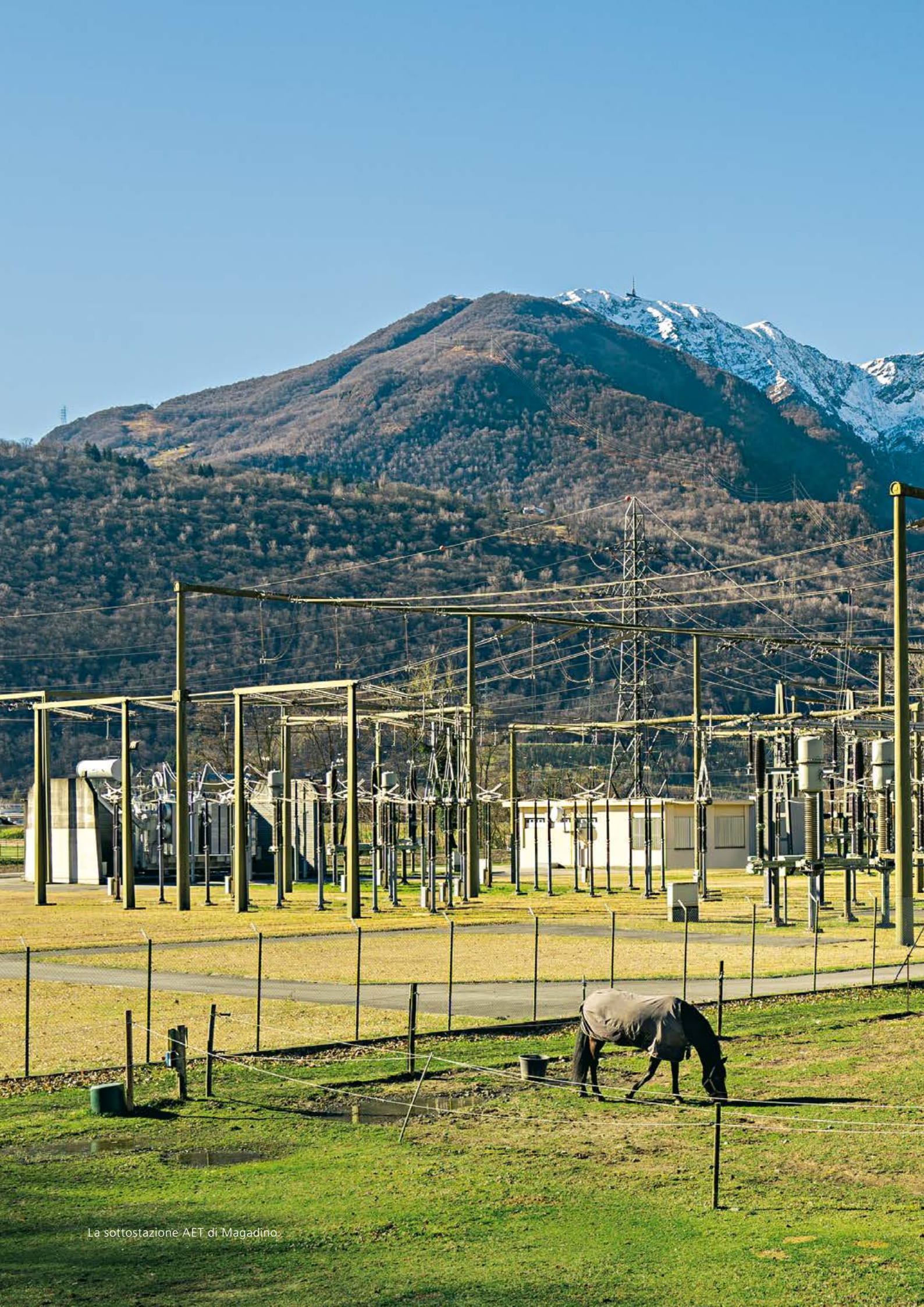
La sottostazione AET di Magadino.