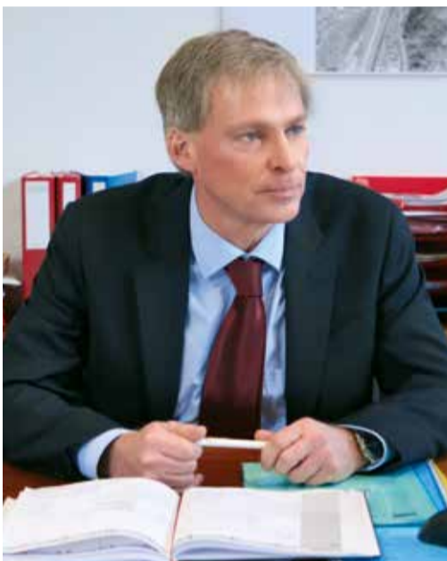
Claudio Zali, Direttore del Dipartimento del territorio

L'applicazione della politica energetica cantonale passa per il Dipartimento del territorio e AET intrattiene rapporti costanti con numerosi suoi uffici. A pochi giorni dalla votazione che deciderà del futuro energetico del nostro paese abbiamo incontrato il Consigliere di Stato Claudio Zali, per fare il punto sulla situazione attuale e gettare uno sguardo alle prospettive future.