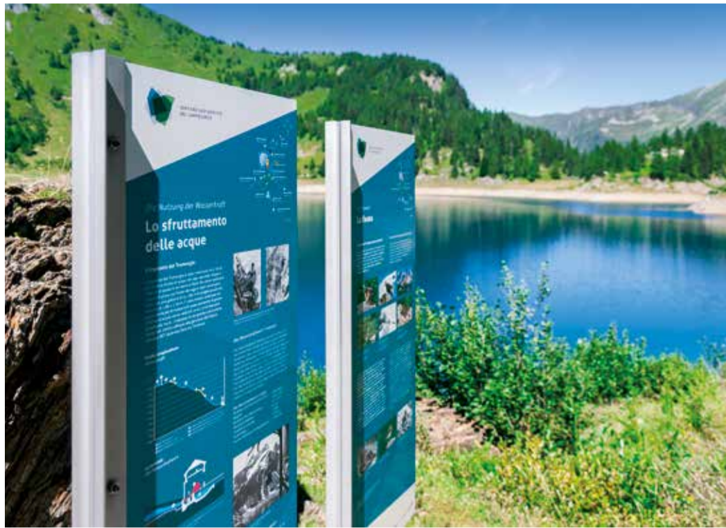
I cartelli tematici del sentiero geoturistico al lago Tremorgio

La regione del Tremorgio è una meta apprezzata da escursionisti di tutte le età: per uno spuntino in capanna, per una gita domenicale con la famiglia o come punto di partenza per una delle innumerevoli escursioni offerte dall'incantevole regione. Il sentiero geoturistico del Campolungo, promosso dal Comune di Prato Leventina ed elaborato assieme al Museo cantonale di storia naturale, è la proposta più recente. Inaugurato nell'estate del 2016 si compone di due percorsi: quello del Tremorgio, che costeggia l'omonimo lago, e quello del Campolungo che conduce a quota 2'250 m s.l.m. fino alla Capanna Leit. Numerosi pannelli informativi posizionati lungo i due percorsi offrono interessanti informazioni sulla geologia, l'idrologia, la mineralogia, la flora e la fauna della regione. Dall' Aquilegia maggiore , uno dei fiori più grandi delle alpi, all'incredibile varietà di rocce e cristalli, gli escursionisti scopriranno un paesaggio alpino idilliaco e unico nel suo genere. Il Tremorgio non è solo un gioiello naturalistico, ma anche una testimonianza della storia della produzione idroelettrica in Ticino. La centrale idroelettrica del Tremorgio risale infatti al 1924, ed è la più vecchia tuttora in funzione lungo la catena produttiva di AET in Leventina.