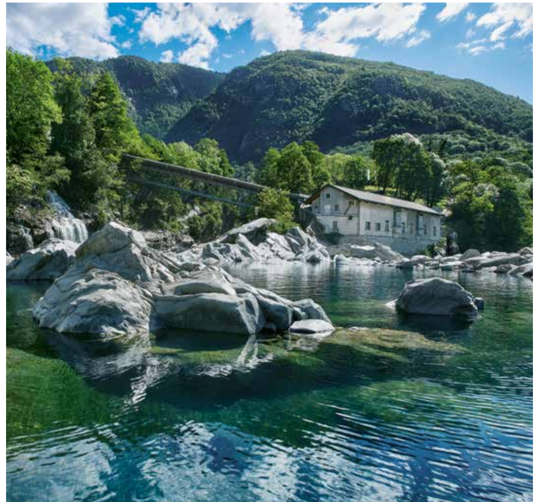
La centrale idroelettrica di Ponte Brolla

A livello d'informazione per la popolazione, mi piace ricordare che abbiamo sviluppato e reso disponibile un portale informativo e di monitoraggio ( www.ti.ch/oasi ) con i dati sulla produzione e i consumi di energia del nostro Cantone, nonché una mappatura che illustra il potenziale della produzione di energia solare.