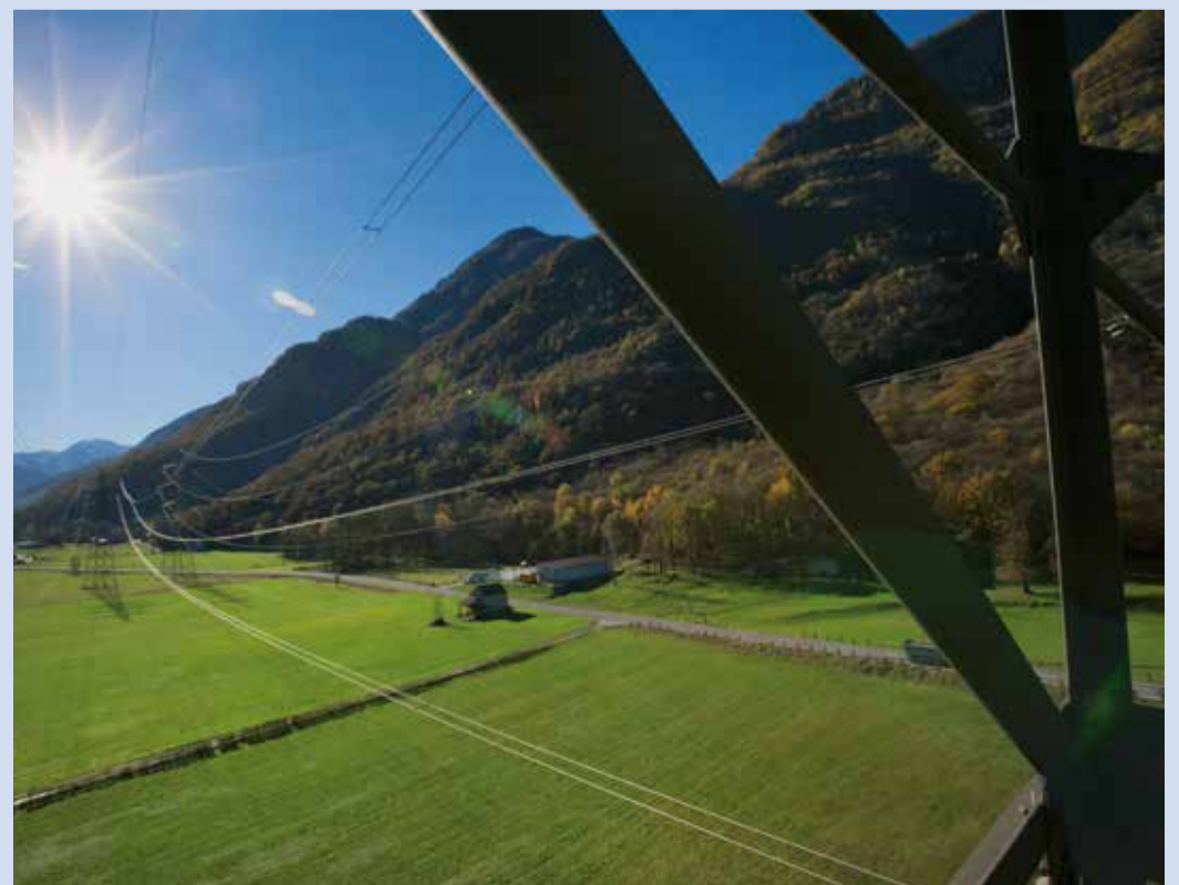
Energia indigena per i distributori ticinesi

Quanto concordato è il risultato del tavolo di discussione sul settore elettrico cantonale promosso dal Dipartimento delle finanze e dell'economia nel 2015. Un'intesa importante e a lungo cercata, che attesta l'impegno dei firmatari in favore del mantenimento di attività economiche di vitale rilevanza per le valli del Locarnese e dell'Alto Ticino.