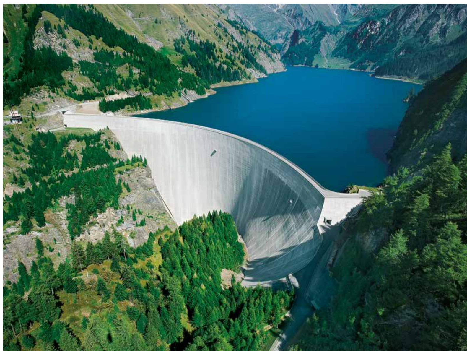
La diga del Luzzone di Ofible

vantaggi anche in termini di forza contrattuale nei confronti di partner e fornitori. L'unione, in questo caso, farebbe davvero la forza. Se poi valutiamo l'operazione a più lungo termine, questo avvicinamento tra Ofima, Ofible e AET andrebbe visto come un primo piccolo passo nella direzione delle rивersioni.