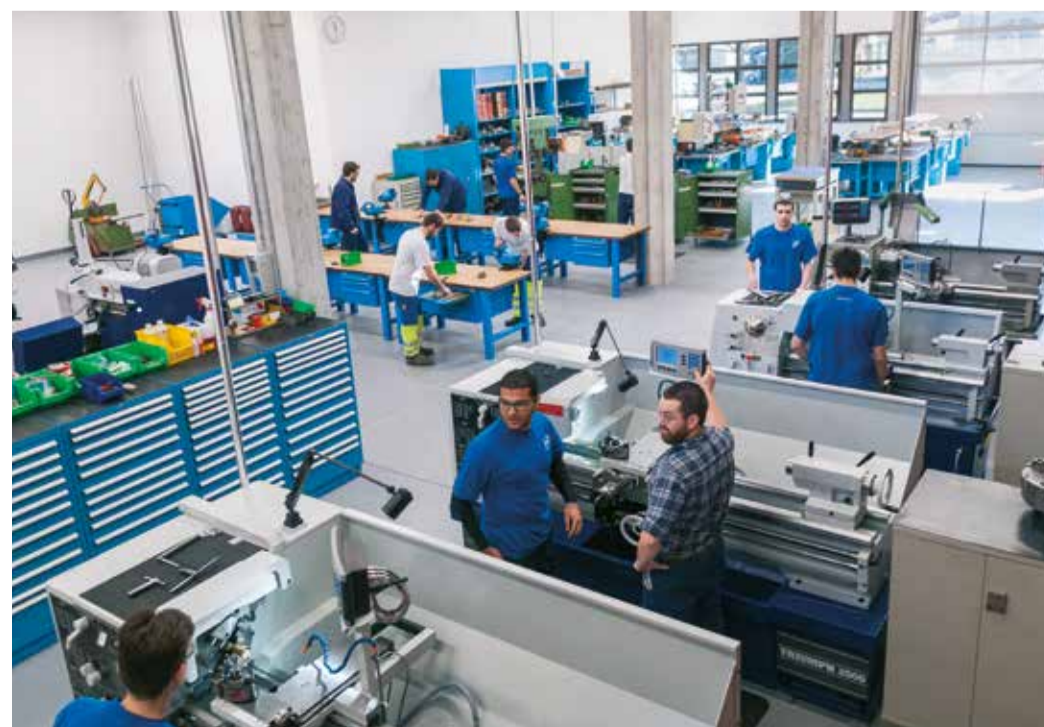
Gli apprendisti del CFB all'opera

riferimento per il settore elettrico cantonale. Questo nucleo di attività fornisce un terreno fertile per lo sviluppo di ulteriori iniziative didattiche, produttive o di ricerca. Un'occasione straordinaria per rivitalizzare una zona che, fin dai suoi albori, è stata protagonista della storia dell'industrializzazione del nostro Cantone.